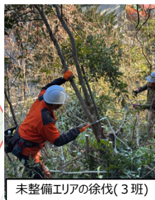
未整備エリアの徐伐(3班)