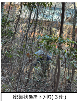
密集状態を下刈り(3班)