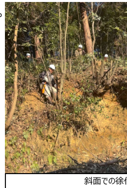
斜面での徐伐作業の様子(2班)