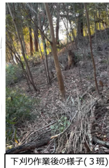
下刈り作業後の様子(3班)