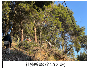
社務所裏の全景(2班)