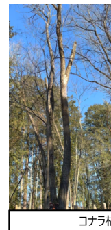
コナラ枯損木の伐倒(4班)