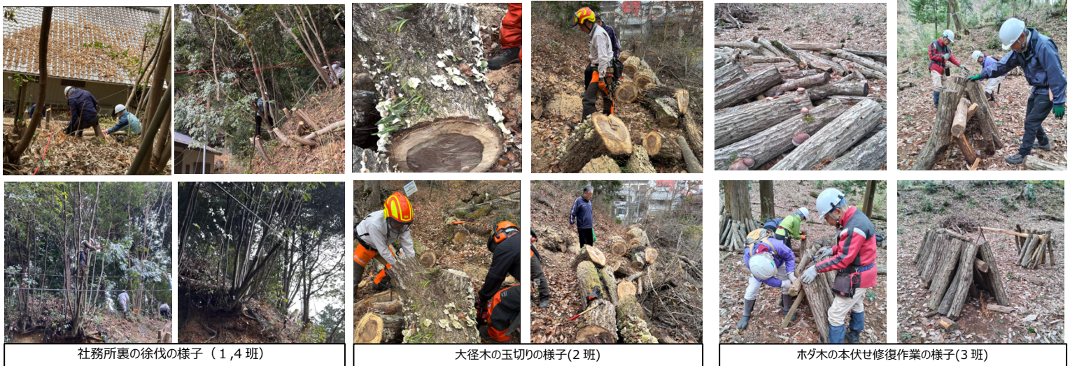
社務所裏の徐伐の様子 (1,4班)