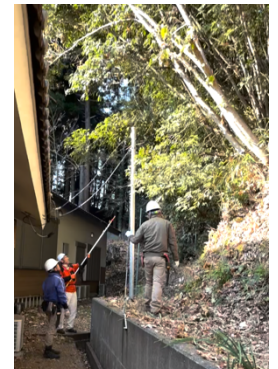
次回作業の確認(2班)