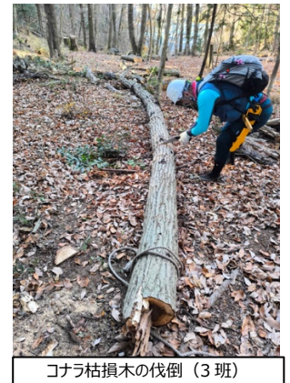
コナラ枯損木の伐倒(3班)