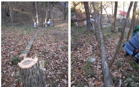
ホダ木用コナラの伐倒作業の様子(1班)