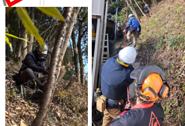
斜面での徐伐作業の様子(2班)