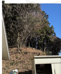
社務所裏作業後(2班)