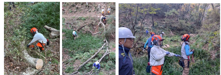
傾斜木の伐倒と玉切り作業の様子、伐倒する際には周囲も注意し待避する