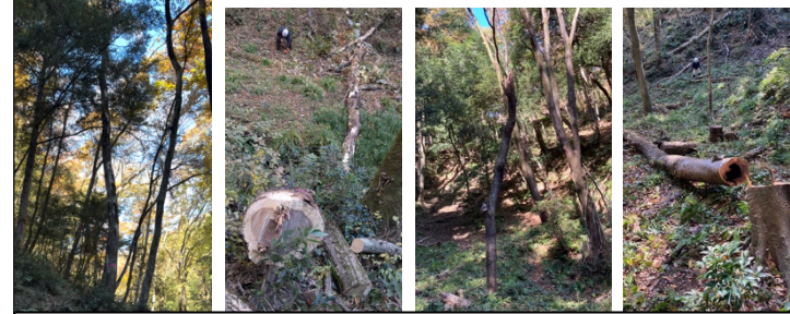
伐倒対象木と伐倒実施後の様子 枯損木を対象として危険除去を目的に実施した