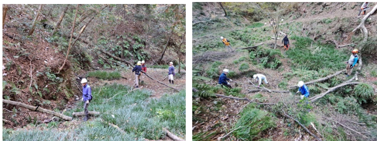
伐倒後の玉切り並びに整備の様子、全員が広がって共同して作業を行なっている