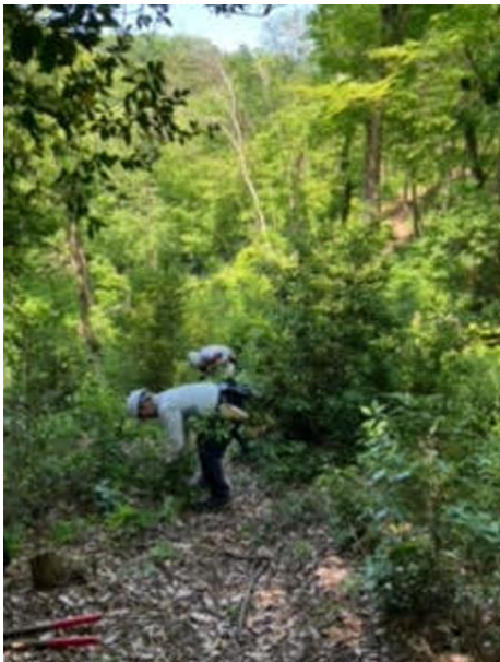
灌木の除伐作業の様子